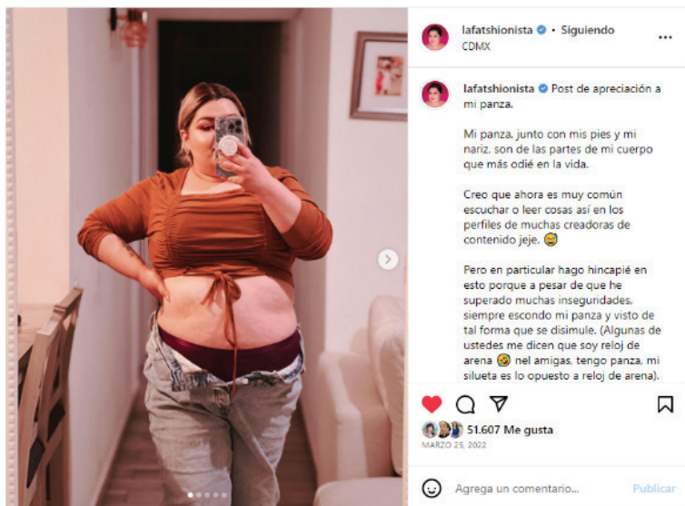
FIGURA 2 PUBLICACIÓN DE @LAFATSHIONISTA