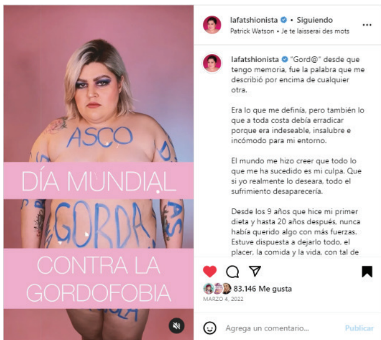
FIGURA 8 PUBLICACIÓN DE @LAFATSHIONISTA