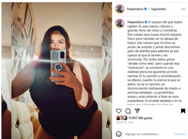
FIGURA 4 PUBLICACIÓN DE @FATPANDORA